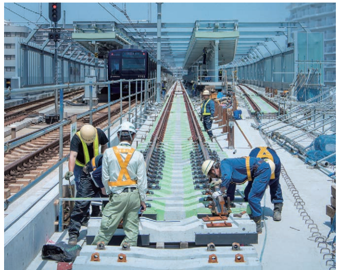
高架化工事(星川駅付近)