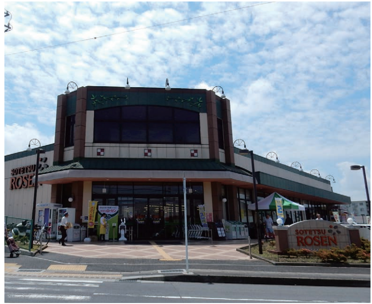
そうてつローゼンかしわ台店