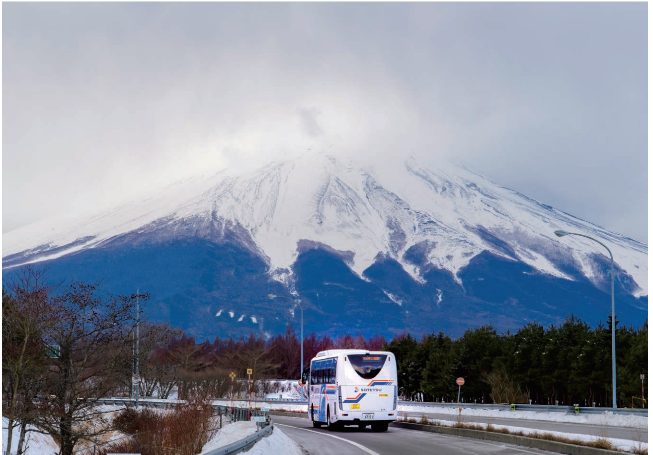
高速バス「ハイウェイクルーザー」：横浜駅西口 - 富士急ハイランド・河口湖駅方面(レイクライナー)