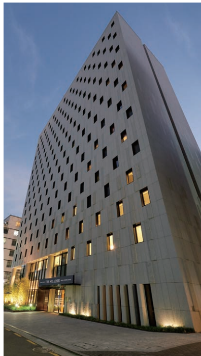
ザ・スプラジール ソウル明洞