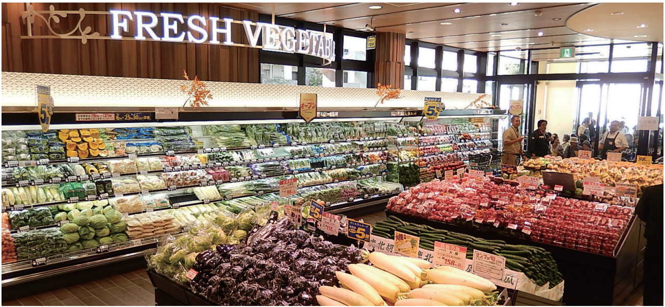
そうてつローゼン南まきが原店