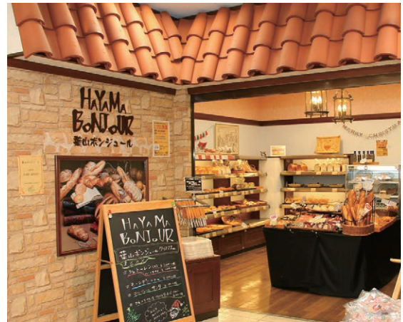
葉山ボンジュール葉山店