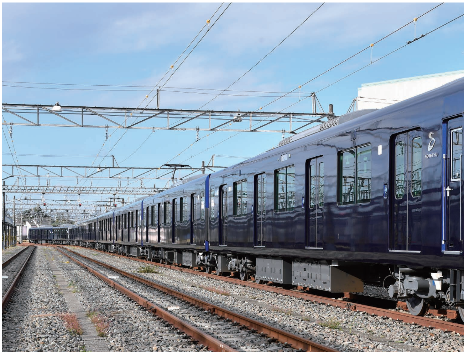
横浜をイメージした色「YOKOHAMA NAVYBLUE」を採用した都心直通用20000系車両