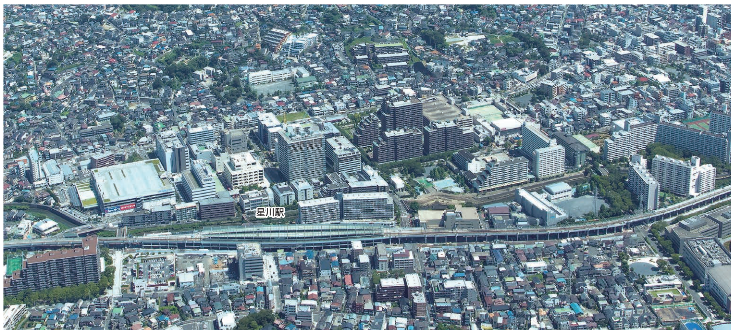
相模鉄道本線(星川駅～天王町駅)連続立体交差事業