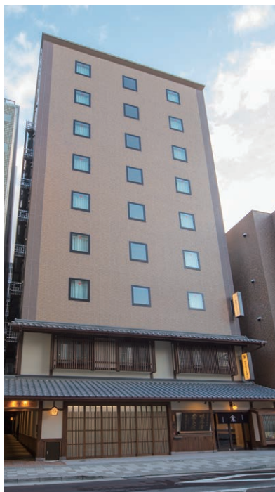
相鉄フレッサイ 京都四条烏丸