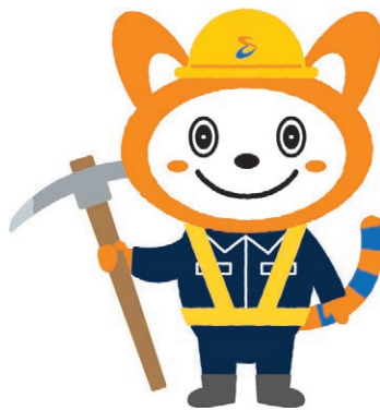
相模鉄道キャラクター「そうにゃん」