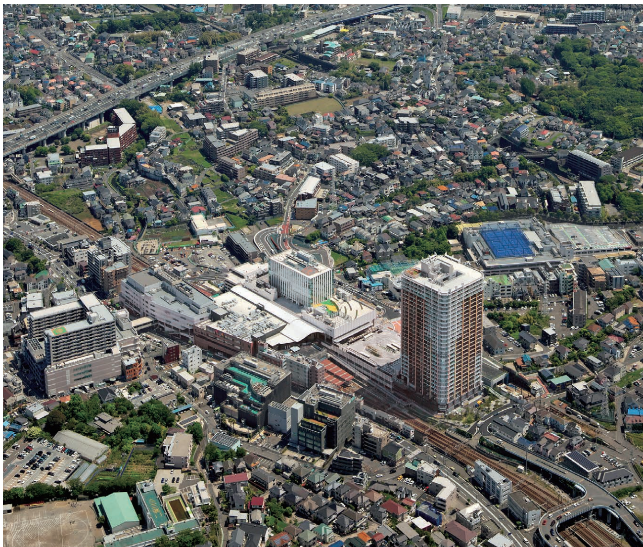
再開発事業により生まれ変わった二俣川駅周辺