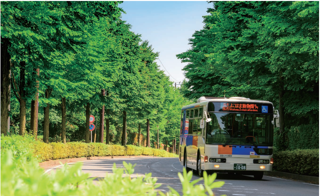
「よこはま動物園北門」行きの路線バス