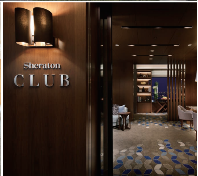
横浜ベイシェラトン ホテル&タワーズ(左下: シェラトンクラブ「ロイヤルスイートルーム」、右下: シェラトンクラブ専用エントランス)