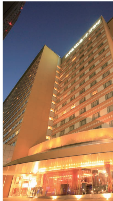
ホテルサンルートプラザ新宿