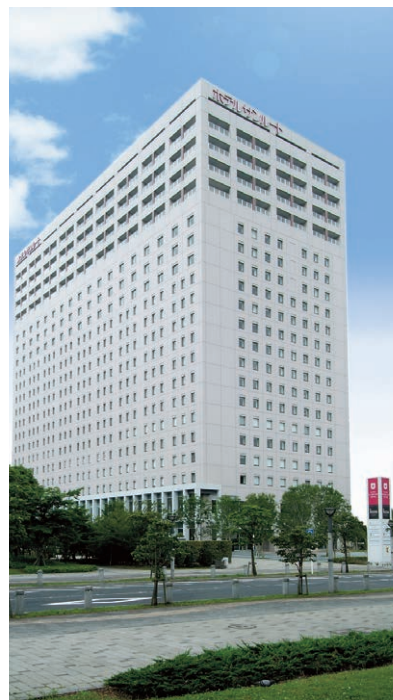
ホテルサンルート有明