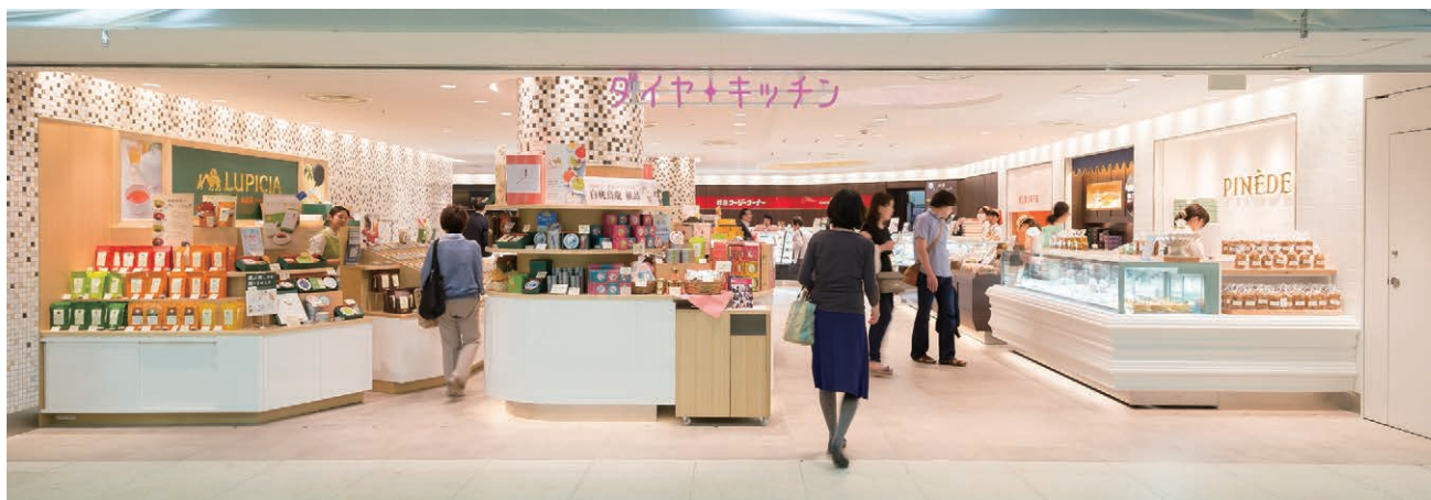
地下1階 ダイヤキッチン