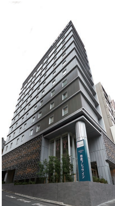
相鉄フレッサイ 東京六本木