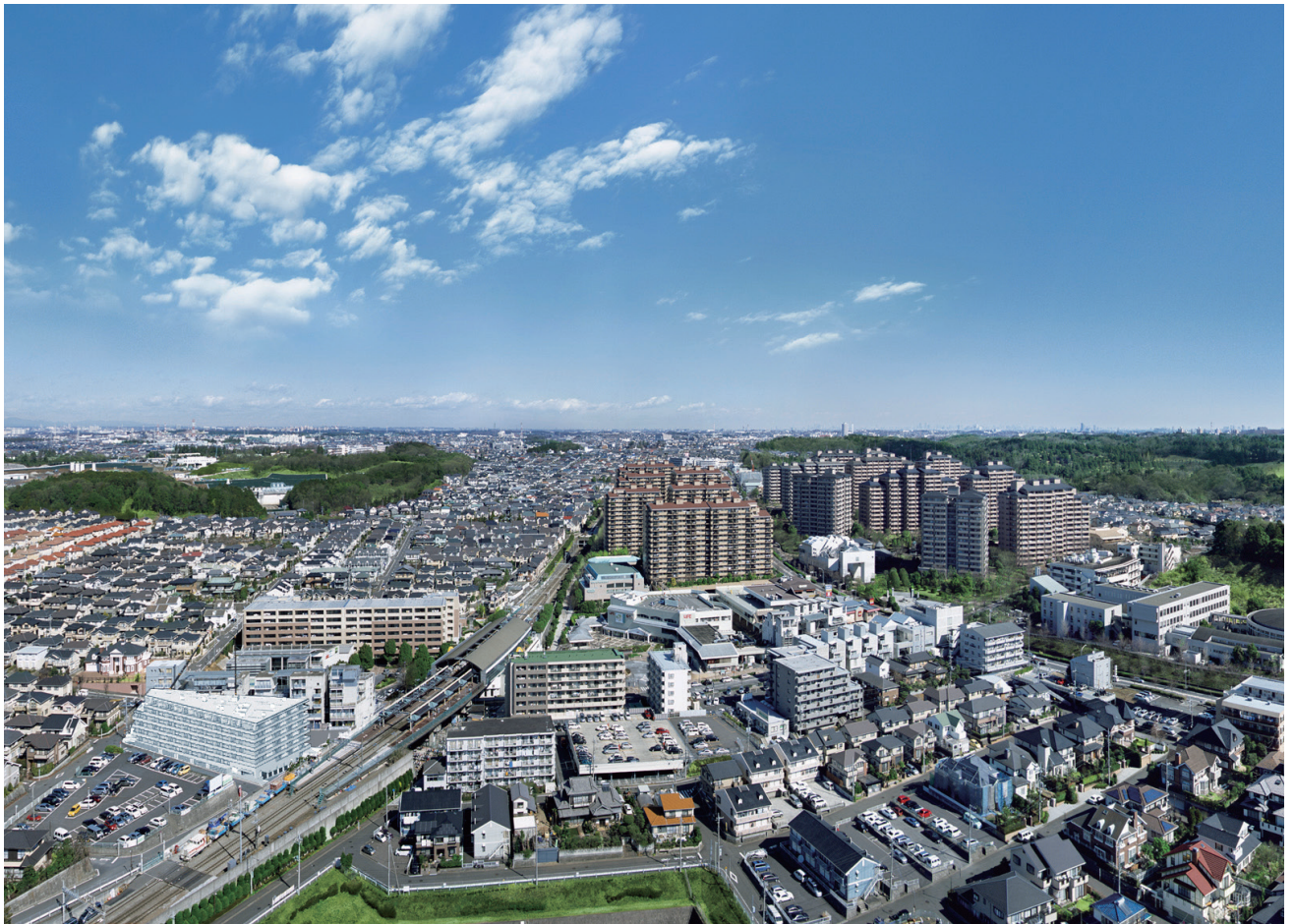
駅を中心に広がる住宅地