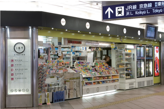
ステーションist 横浜1階改札前