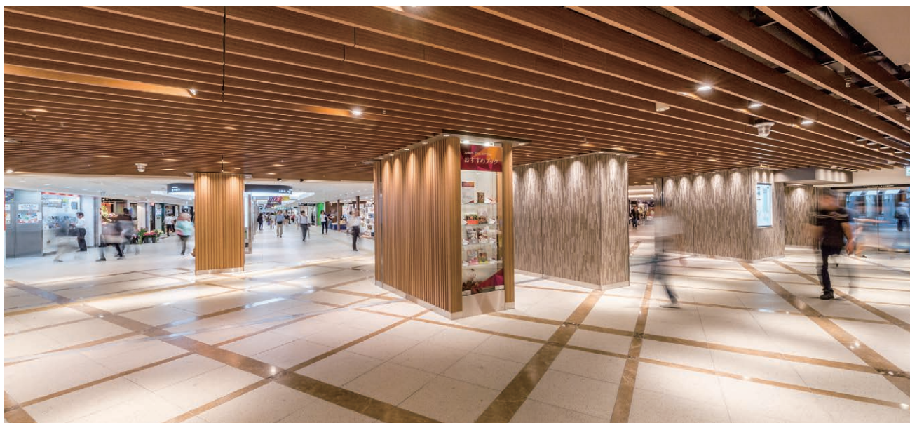
地下1階 ホテル前広場