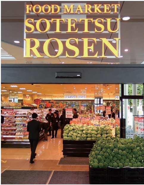
そうてつローゼンジョイナステラス二俣川店