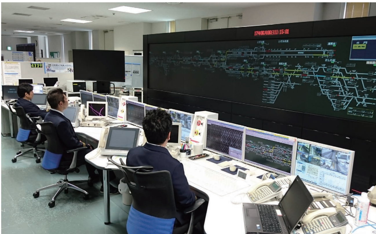
TTCを導入した運輸指令所