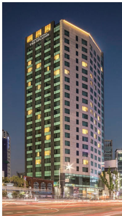
ザ・スプラジール ソウル東大門