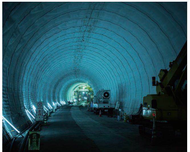
JR線・東急線との相互直通線のトンネル工事(西谷駅付近)