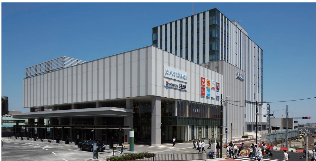
ジョイナステラス二俣川