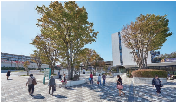
南万騎が原駅周辺