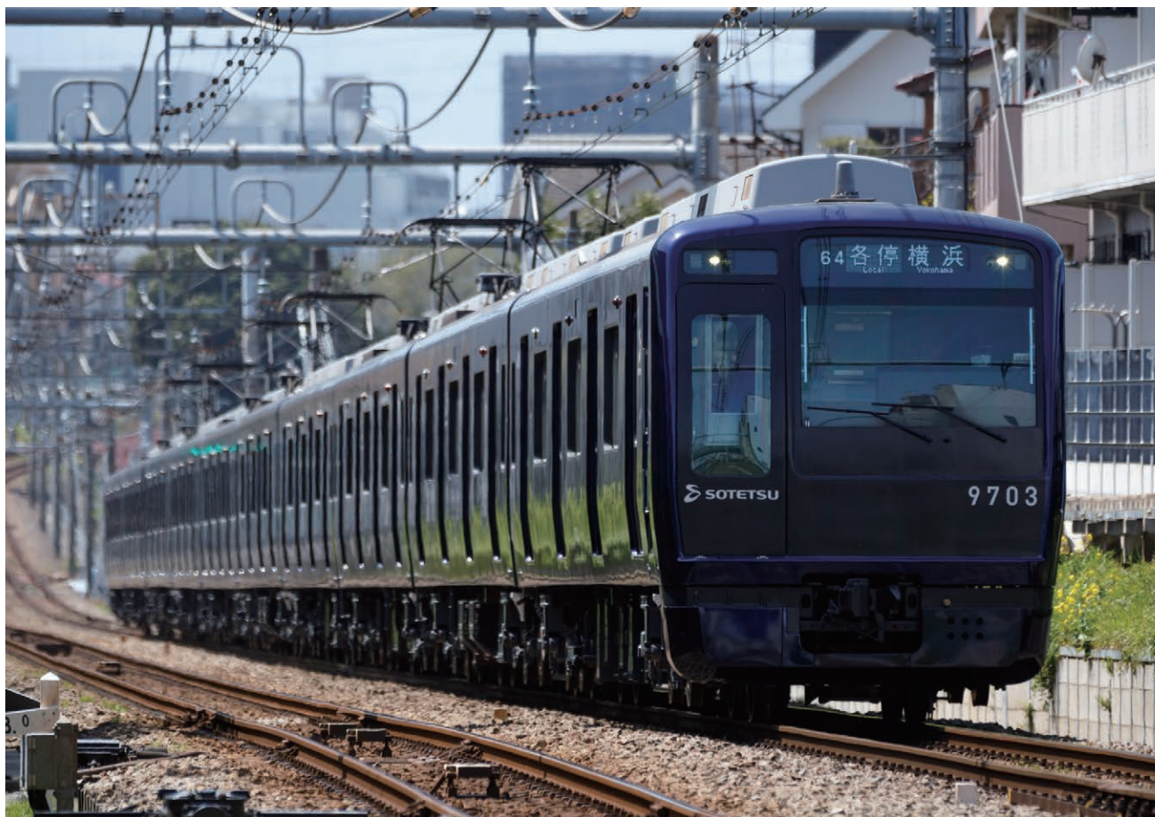
「YOKOHAMA NAVYBLUE」を採用した9000系リニューアル車両